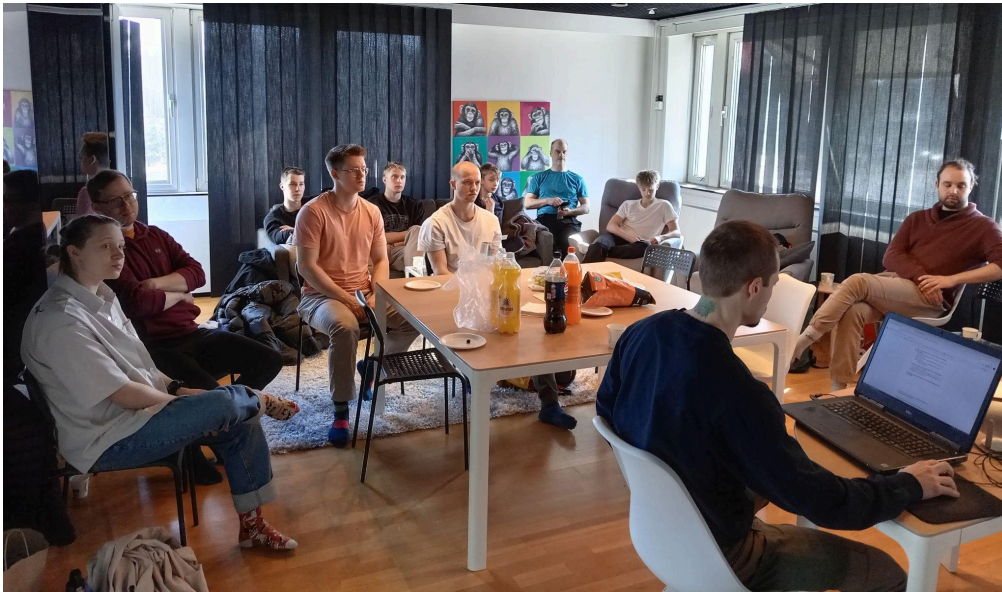
Vuosikokous 2025.