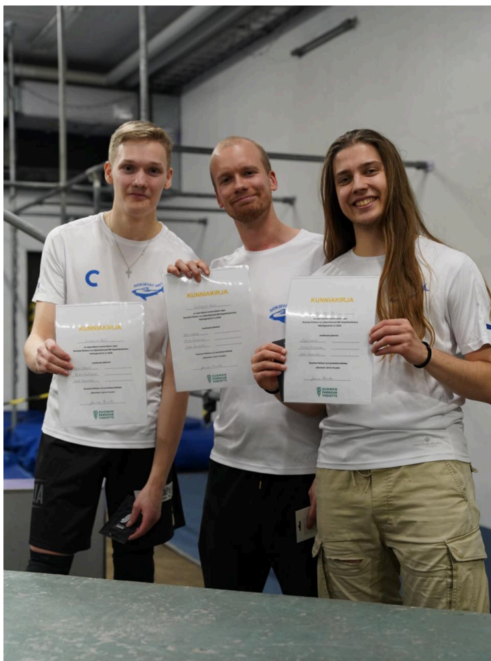
Avoimen sarjan voittajajoukkue Juoksevat hait.