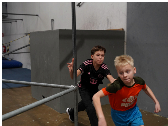
Kovaa menoa lasten sarjassa.