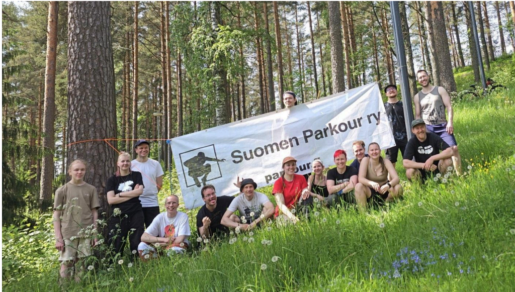
Flow Finland Jyväskylä.