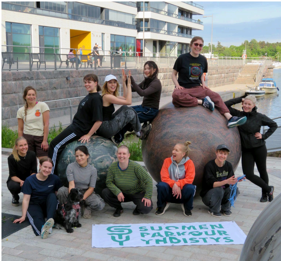
Girls & Co. Helsinki.

Girls & Co -parkourjamit järjestettiin kaksi kertaa Flow Finland -kiertueen sisartapahtumana. 6.6. jamit järjestettiin Helsingissä, jossa workshopin veti Sanni Vesterinen. 13.6. jamit järjestettiin Jyväskylässä, jossa workshopin piti Aada Mäkelä. Tapahtumat on tarkoitettu kaikenikäisille tytöille, naisille ja sukupuolivähemmistöihin kuuluville. Tapahtumat ovat olleet hyviä tilaisuuksia tulla mukaan parkouriin matalalla kynnyksellä ja ne ovat toimineet ponnahduslautana lähteä myös muihin parkourkokoontumisiin. Tapahtumien kautta toimintaan onkin tullut mukaan uusia harrastajia aiempina vuosina. Koska osallistujia on ollut vähän, ovat osallistujat saaneet paljon henkilökohtaista ohjausta lajin pariin.