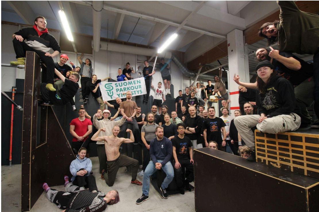
SPKA Jyväskylä 2025.